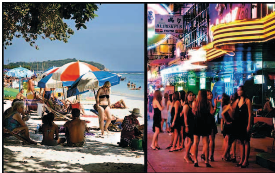
Thailand som de flesta tänker sig det...men bakom fasaden döljer sig en mörkare värld.